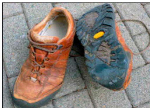
Fertig: Ein paar Wanderschuhe hat der Herborner auf seiner Tour, die mit Unterbrechung von März bis September gedauert hat, abgelaufen.

„Hatten Sie keine Angst gehabt, draußen zu schlafen?“,